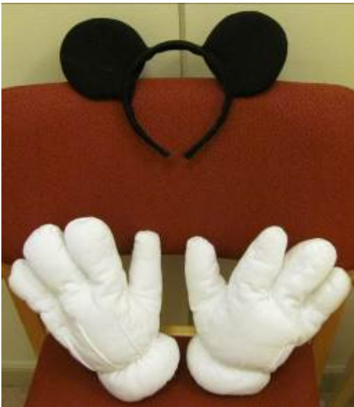
Musse Pigg – tillbehör Pris 5,-