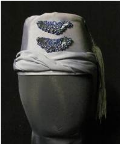
Nr. 507 Sultanhatt 57 cm