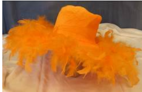
Nr. 601 Pris 10,- Hatt med fjädrar