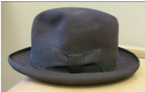
Nr. 517 Pris 10,- Filthatt 58 cm