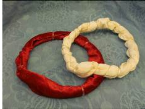
Nr. 408 Pris 5,- Pannband