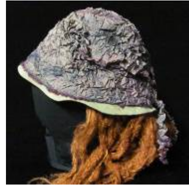
Nr. 514 Pris 10,- Hatt med rött hår One size