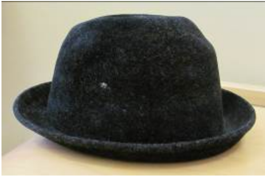
Nr. 505 Filthatt 57 cm