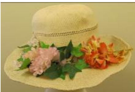
Nr. 404 Pris 10,- Stråhatt med blommor 56 cm