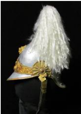
Nr. 515 Pris 10,- Romersk hjälm 57 cm