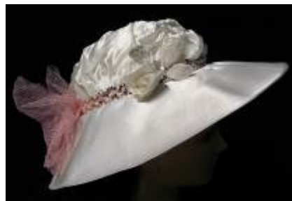
Nr. 403 Pris 10,- Silkeshatt med paljetter och tyll 56 cm