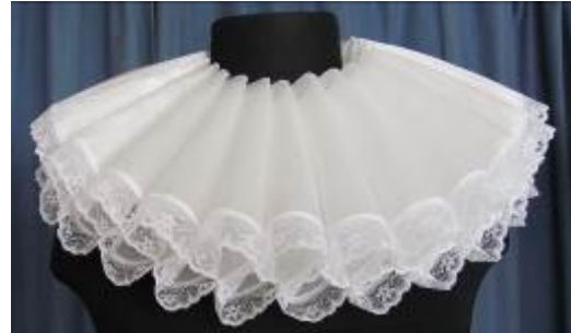
Kvarnstenskrage Pris 15,-