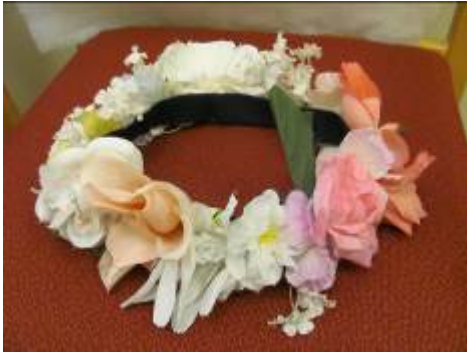
Nr. 407 Pris 5,- Rosenpannband