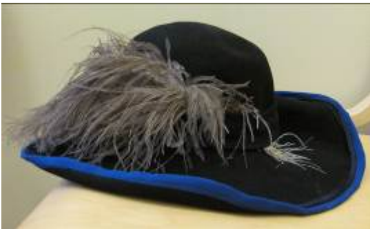
Nr. 510 Stråtrövarhatt 59 cm