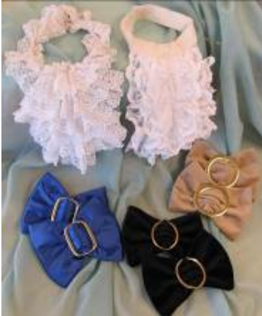
Skjortkrås Pris à 5,- Skorosetter