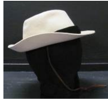
Nr. 506 Pris 10,- Filthatt med band 58 cm