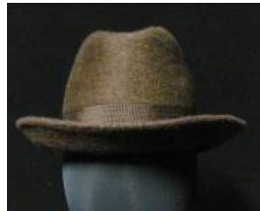
Nr. 501 Pris 10,- Filthatt 57 cm