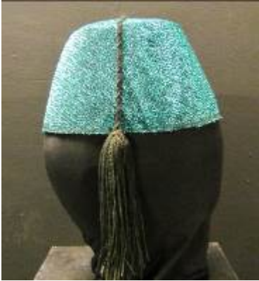
Nr. 513 Pris 10,- Fez 58 cm