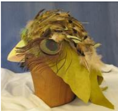
Nr. 602 Pris 10,- Fågelhatt