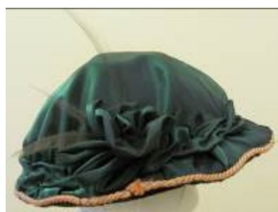
Nr. 405 Pris 10,- Silkeshatt One size