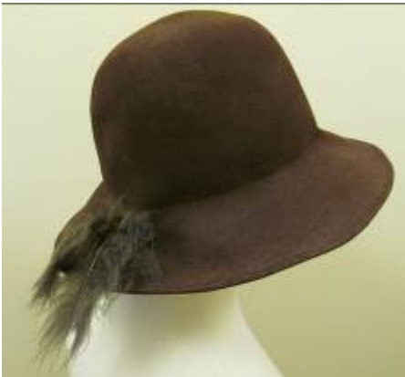
Nr. 500 Pris 10,- Filthatt 58 cm