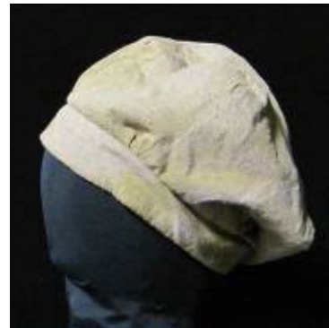
Nr. 511 Pris 10,- Medeltidsmössa 62 cm