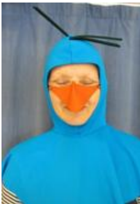
Nr. 604 Pris 10,- Fågel med näbb