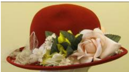
Nr. 402 Pris 10,- Filthatt med blommor 56 cm