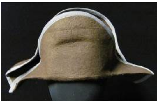
Nr. 503 Pris 10,- Napoleonhatt 60 cm