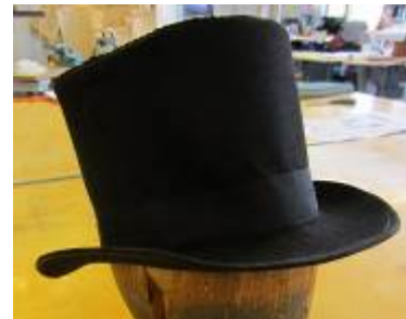
Nr. 504 Pris 10,- Hög filthatt 58 cm