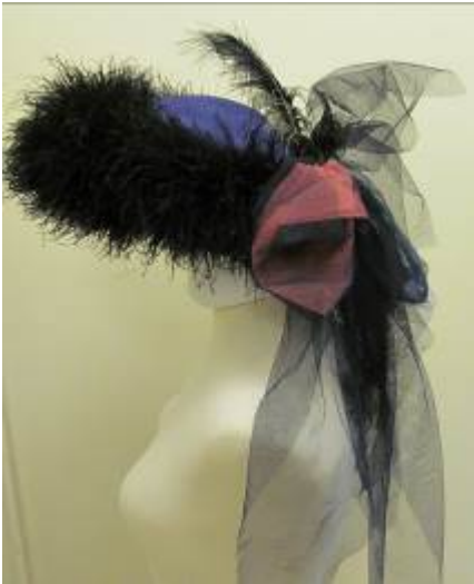
Nr. 400 Pris 10,- Filthatt med tyll och fjädrar 55 – 58 cm