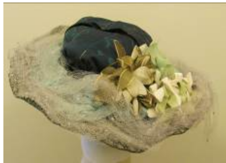
Nr. 401 Pris 10,- Tyghatt med nät och blommor One size