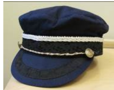
Nr. 508 Pris 10,- Skepparmössa 58 cm