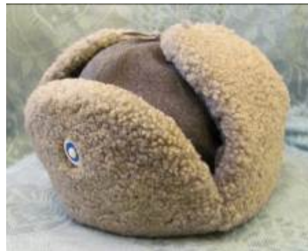
Nr. 516 Pris 10,- Finska arméns jägarmössa 56 cm